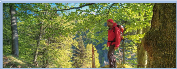
... Wandern in schönsten Naturlandschaften