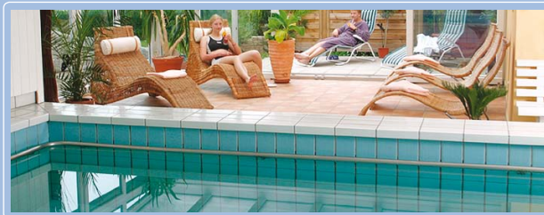
... unser Schwimmbad